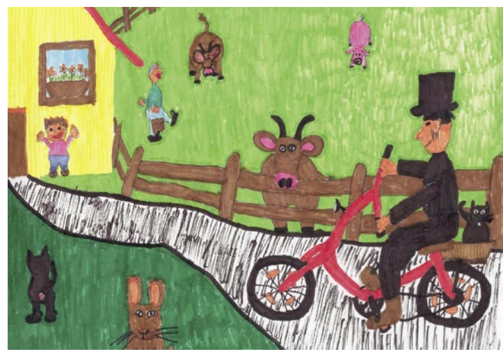
Glückstour 2009; gemalt von krebserkrankten Kindern Station 2c, Uniklinik Erlangen