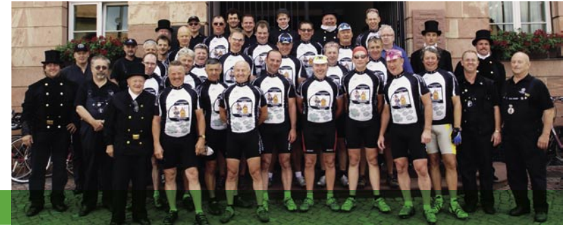
Die Teilnehmer der Glückstour 2008

Wir freuen uns sehr, dass sich in diesem Jahr noch mehr Firmen aktiv oder durch Spenden an unserer Aktion beteiligen wollen. Damit die „Tour“ auch in diesem Jahr zum Erfolg wird, brauchen wir auch die Hilfe aller Kollegen, Freunde und Interessierten Mitmenschen. Nur wenn wir gemeinsam zum Erfolg beitragen, können wir wirksam helfen.