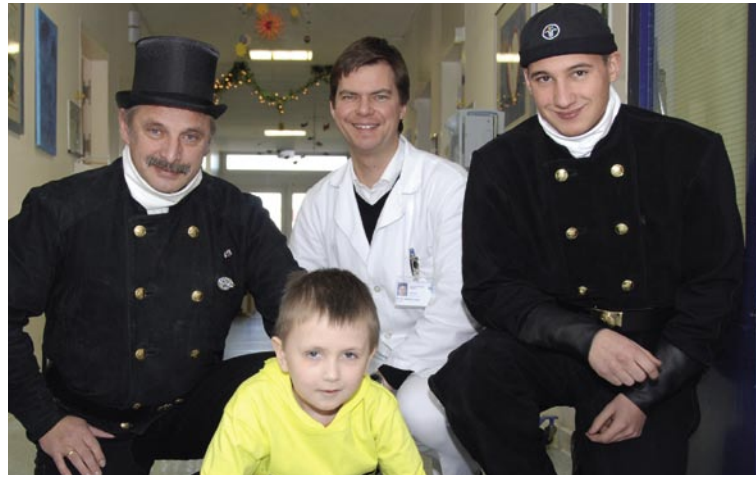
Schon immer ein Glücksbringer - jetzt auch für krebserkrankte Kinder

Die Aktion stellt nicht nur die Hilfe für krebserkrankte Kinder sicher. Die Förderung von Forschungsprojekten soll auch dazu beitragen, dass gesunde Kinder nicht krank werden.